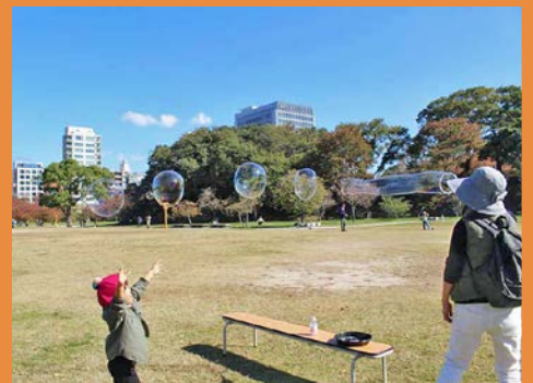
ジャンボシャボン玉