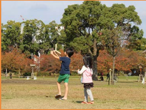
ペーパーブーメラン