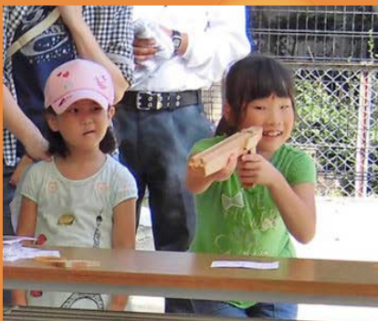
ゴム銃で射的ゲーム