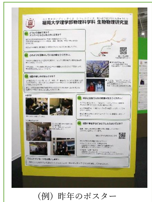
(例) 今年のポスター