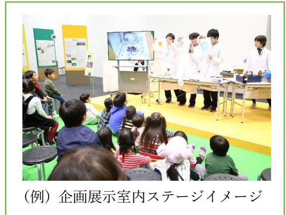
(例) 企画展示室内ステージイメージ

※その他必要な備品（長机、追加のパネル、イス等）があれば、「出展希望届」に明記してください。ご希望に添えない場合もございますので予めご了承ください。