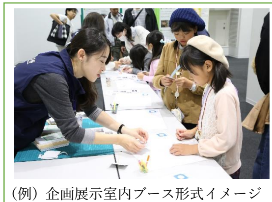
(例) 企画展示室内ブース形式イメージ

※実験室スケジュールは、希望団体数に応じて調整するため、ご相談させていただくことがあります。